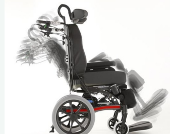
Μεγάλες γωνίες ανάκλισης καθίσματος