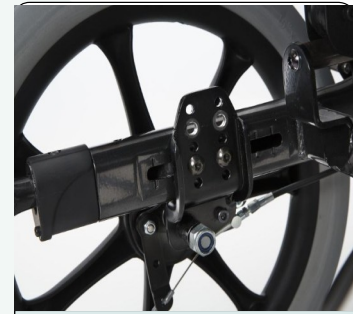
Ρυθμιζόμενο μεταξόνιο τροχών