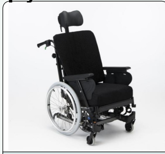
Χαμηλό ύψος καθίσματος