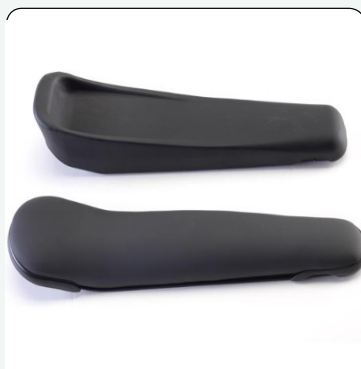
Νέα εργονομικά μπράτσα