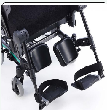
Αυτόνομα υποπόδια με ρύθμιση θέσης