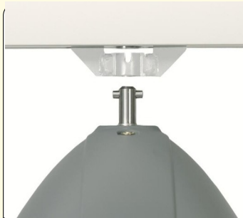
Εύκολη σύνδεση/αποσύνδεση του μηχανισμού στις ράρες χωρίς εργαλεία

Η προσαρμογή του πλάτους του ιμάντα στο σχήμα του σώματος του ασθενή αποτρέπει την καταπόνηση του σώματος