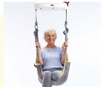
Πολλά αξεσουάρ διαθέσιμα