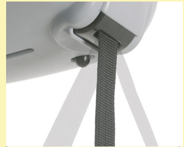
Αυτορυθμιζόμενη είσοδος ιμάντα

Η προσαρμογή του πλάτους του ιμάντα στο σχήμα του σώματος του ασθενή αποτρέπει την καταπόνηση του σώματος