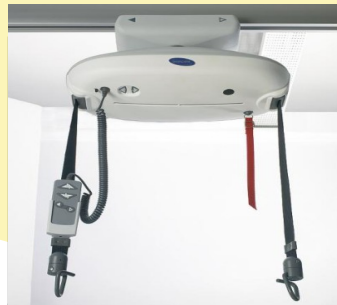
Συμπαγής μονάδα ανύψωσης