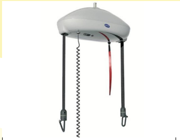
Σύστημα με δυο ιμάντες